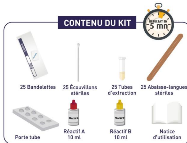
Exemple de Kit

d) Si le test est positif, le pharmacien peut alors prescrire un antibiotique : FAUX